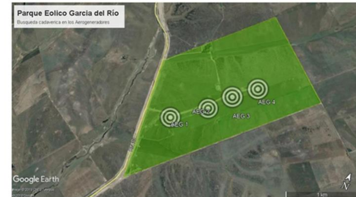
Mapa 1.1.- Radios concéntricos sobre cada AEG, para la búsqueda de cadáveres o restos de fauna voladora